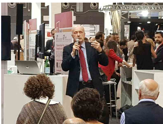
Guarda la gallery

Anche perché, è stato evidenziato da Gaetano Settimo - Ricercatore dell'Istituto Superiore di Sanità ed Esperto dell'OMS: "L'inquinamento indoor, secondo l'Organizzazione Mondiale della Sanità, sorprenderà: ma è 10 volte superiore a quello outdoor. L'inquinamento indoor uccide, ogni anno, 90.000 mila persone in Europa e non risparmia nessuno".