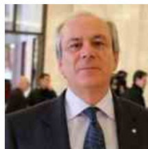
Armando Zambrano | Presidente Cni.

«Secondo i dati pubblicati in un nostro studio a fine anno il costo per i vari bonus ammonterà a 12,5 miliardi di euro. In compenso essi attiveranno 26 miliardi di euro di produzione con una crescita del Pil pari a 16 miliardi di euro. Stimiamo che allo Stato possano rientrare tra gli 8 e i 9 miliardi di euro sotto forma di tasse. Quando si giudicano i costi dei Superbonus occorre tenere conto di queste cifre. Per non parlare del numero di vite che si possono mettere in salvo migliorando la sicurezza degli edifici, ai costi di ricostruzione post terremoto che potranno essere risparmiati, ai minori costi sanitari per malattie polmonari per effetto del miglioramento delle condizioni di vita in abitazioni adeguate, oltre alla valorizzazione del nostro patrimonio edilizio e del suo valore, riducendo anche i costi del nostro debito pubblico. Occorre potenziare il Sisma Bonus. In 60 anni abbiamo speso circa 150 miliardi di euro in ricostruzioni. È necessario cambiare la prospettiva. Se consideriamo che gli edifici della dorsale appenninica, quelli più esposti al rischio sismico, sono costituiti in gran parte da unità unifamiliari, immaginare delle limitazioni all'applicazione del bonus, anche attraverso lo strumento dell'Isee, è una strada del tutto sbagliata». (vb)