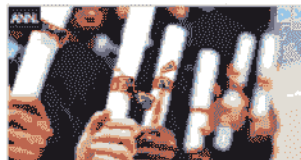
Laurea in Psicologia